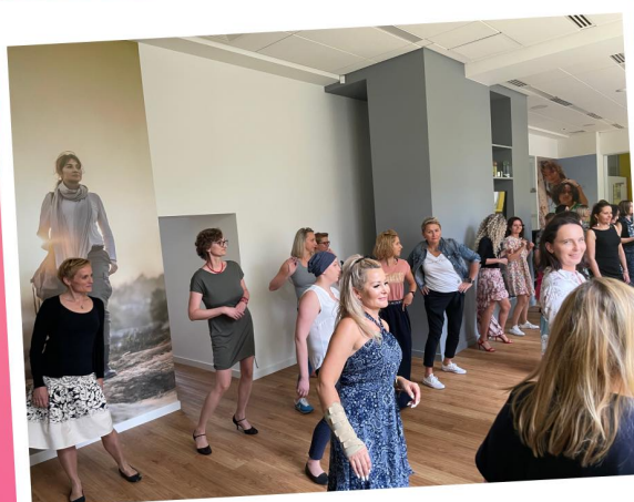
Warsztaty Latino 28.08.2021